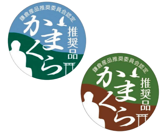
かまくら推奨品ステッカー

鎌倉産品推奨委員会では、鎌倉ならではの魅力ある産品を鎌倉の推奨品として認定するため、第16回かまくら推奨品認定会を昨年11月27日(月)に実施しました。「かまくら推奨品」として、 3事業所3品目 が新たに認定され、 8事業所10品目 が再認定されました。