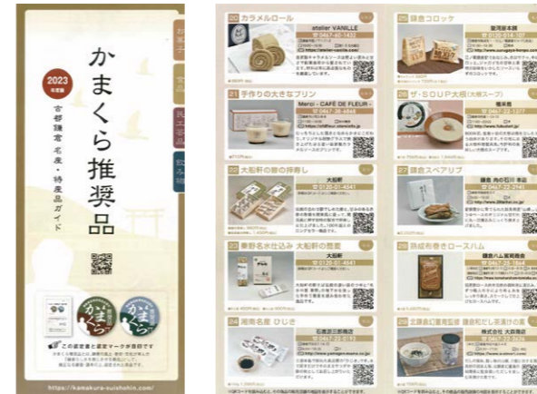
2023年度版推奨品カタログ