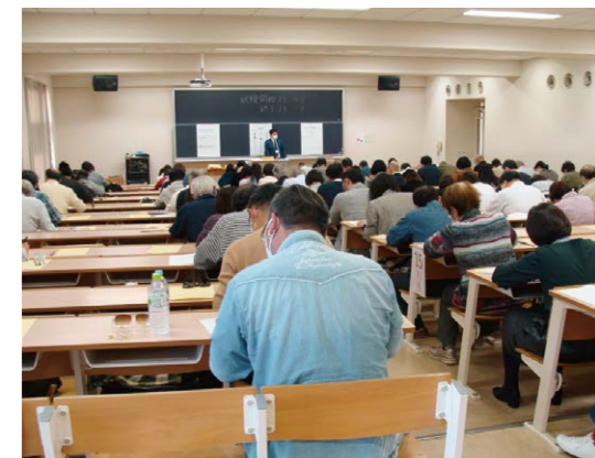
前回の試験でも、多くの方が受験しました

鎌倉検定ホームページから過去の問題・解答をダウンロードできますので、一度力試しにチャレンジされてみてはいかがでしょうか。