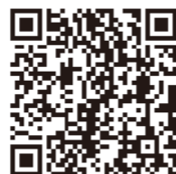
申告書作成はこちら