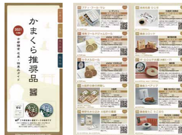
2021年度版推奨品カタログ