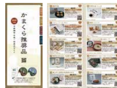
2020年度版推奨品カタログ

鎌倉産品推奨委員会では、鎌倉ならではの魅力ある産品を鎌倉の推奨品として認定するため、第13回かまくら推奨品認定会を昨年11月27日(金)に実施しました。「かまくら推奨品」として、6事業所7品目が新たに認定され、17事業所23品目が再認定されました。