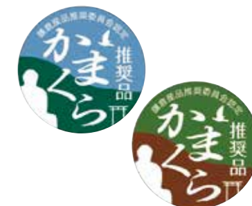
かまくら推奨品ステッカー