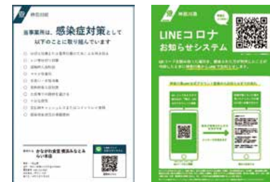
取組書 (店先に提示) QRコード読取用紙 (来店者が読取)