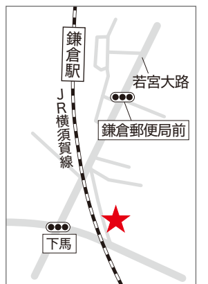
鎌倉サポート会場(HATSU鎌倉)