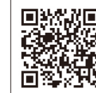
銀の鈴社 電子ブックストア

銀の鈴社の電子書籍、約500点を、期間限定で無料開放しています。0円でレンタル購入後、31日間の閲覧が可能です(コンテンツの会員登録(無料)が必要です)。