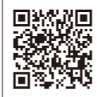
銀の鈴社 電子ブックストア