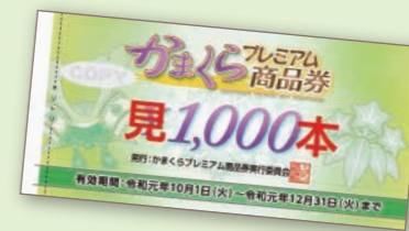
かまくらプレミアム商品券

かまくらプレミアム商品券の換金期限は、 令和2年1月31日(金) までとなっております。期限を過ぎると、商品券の換金はできなくなりますのでご注意ください。お手数ですが、申請時に指定された換金取扱支店にて余裕をもって換金手続きをお願いいたします。