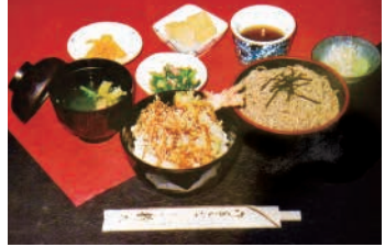
人気メニュー「小天丼セット」。法事などには予約でコース料理も。

和風レストラン 静久 〒248-0005 鎌倉市雪ノ下1-12-13 TEL 0467-25-0250