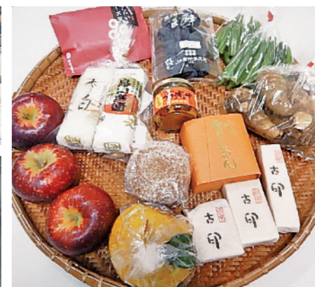
※実際の販売品目と異なる場合があります