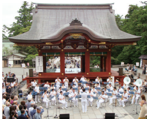
前回の演奏会の様子