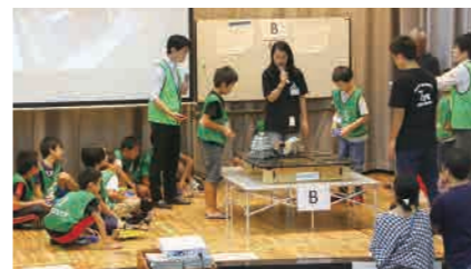
対戦競技会の様子

イロポット」のデザインコンテストを、午後には正方形の「土俵」を試合場とみなし、相手ロボットを場外に押し出すなどの対戦競技会も行われました。会場には参加者のお友だちや応援の父兄などが多数ご来場されて、大いに盛り上がりました。 鎌倉は観光だけの町ではなく「メイド・イン鎌倉」の製品・技術も多数あり、工業部会では、これらを展示することによってより多くの方々による実態を知っていただき、あわせて子どもたちにモノづくりの楽しさ、醍醐味を感じてもらおう目的でこの展示会を開催しています。来年度もさらにより発展した形で実施していく予定です。