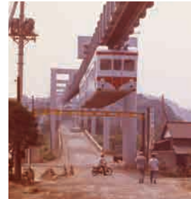
同社に残る写真。開業に向けた試験走行。

〒248-0022 鎌倉市常盤18 TEL 0467-45-3181 HP http://www.shonan-monorail.co.jp