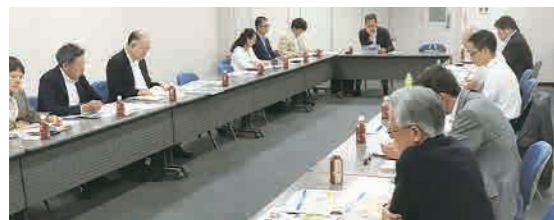
北陸経済連合会との情報交換会

台風一過の快晴となった2日目は、武家屋敷を見学・散策した後、国の重要伝統的建造物群保存地区に選定されている「ひがし茶屋街」を訪れ、美しい出格子と石畳が続く古い街並みに