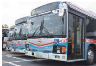
バス全体を傾けることで段差を少なくし、乗降をしやすくするノンステップバス

住民にとっても観光客にとっても欠かすことのできない鎌倉の足。さらなる発展に期待が高まります。 京浜急行バス株式会社 鎌倉営業所 〒248-0014 鎌倉市由比が浜2-1-12 TEL.0467-23-2553 HP http://www.keikyu-bus.co.jp/